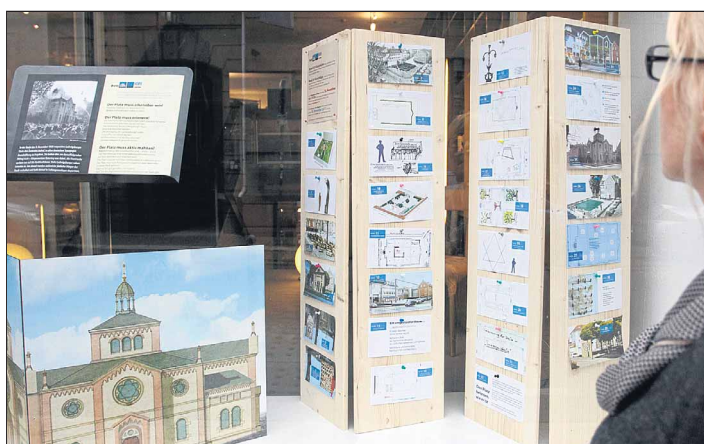
Ausstellung zu den Vorschlägen der Bürger im Möbelhaus Sommer in der Alleenstraße.

Ein ganz besonderer Gast wird am kommenden Donnerstag die Gedenkveranstaltung auf dem Ludwigsburger Synagogenplatz an der Ecke Alleen-/Solitudestraße begleiten: Landesrabbiner Netanel Wurmser. Er trägt einen Psalm und ein jüdisches Totengebet vor. Eingeleitet wird die Erinnerung an die Pogromnacht mit Ausschnitten aus der Mauthausen-Kantate von Mikis Theodorakis und Jakovos Kambanelis. Die Musik wird von Fotografien einer Mauthausen Ausstellung illustriert. Im Anschluss daran spricht Ludwigsburgs Sozialbürger-